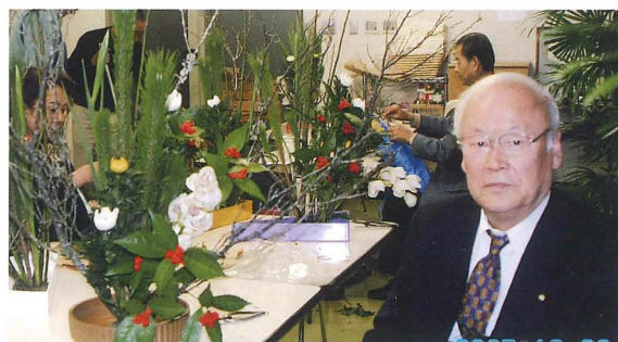
写真は現在も続けております、閑淵流生花教室での写真です。

生きがいと健康が必要になってきますが、今一番力を入れているところは「足腰の強化」です。足の筋肉が非常に弱くなり、少し無理をすると足が痛んで、サポーターを付けたり、シップを貼ったりして休む日もあります。もう一つ大切にしているのが姿勢です。年を取るとどうして