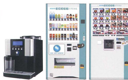
オフィスコーヒー

ASEED 本社：広島県福山市箕島町 5725 番地 1 TEL 084-982-8800