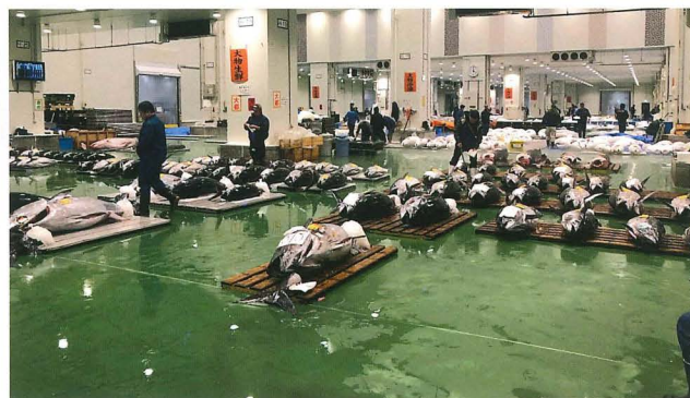
「豊洲新市場内の様子」