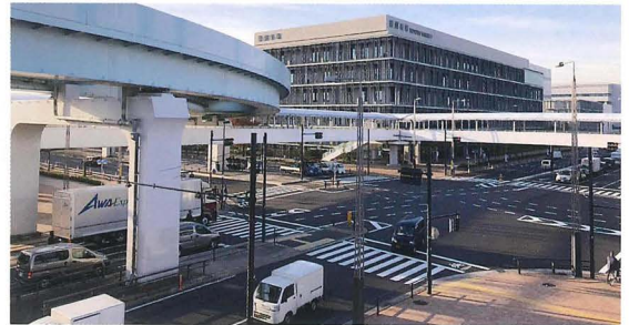
「ゆりかもめ線から見た豊洲新市場（水産卸売場棟 7街区）」

然しながら、如何せん老朽化が進む中、衛生状態などの悪化に鑑み、また築地での再生は難しい等の判断から、豊洲への移転が決定されました。移転に至るまで各種意見や紆余曲折がありましたが、ようやく昨年10月開場の運びとなりました。